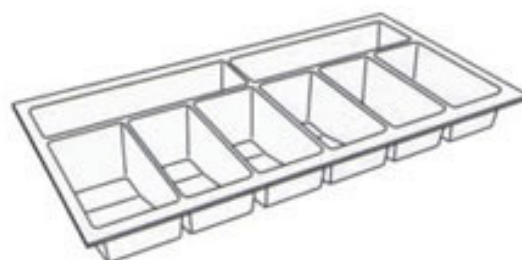
PORTA NOTAS BD-01 520x282x70