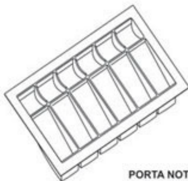
PORTA NOTAS MF-01 510 x 330 x 55 min.: 505 x 305 max.: 550 x 350