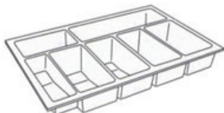
PORTA NOTAS BM-02 407x292x75