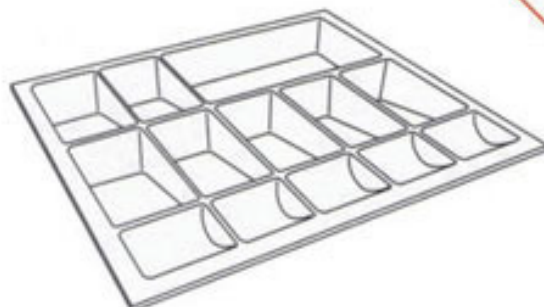
PORTA NOTAS AM-01 478x425x55 min.: 468 x 415 máx.: 497 x 435