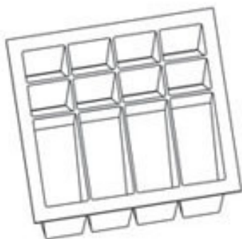
PORTA NOTAS RS-01 360 x 322 x 60 min.: 350 x 312 max.: 380 x 342