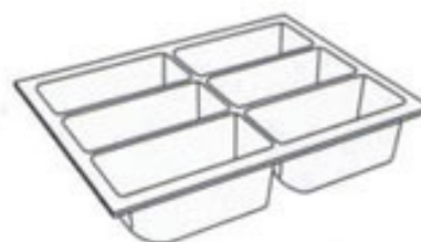
PORTA NOTAS CP-01 270x350x69 min.: 235 x 312 máx.: 290 x 362